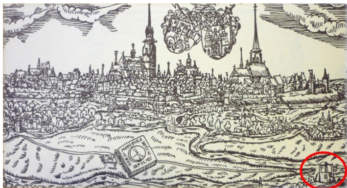
Obr. 1. Veduta Plzne z roku 1601, autor J. Willenberger.