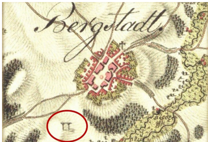
Obr. 2: Šibenica znázornená pri Hornom Meste (okr. Bruntál).