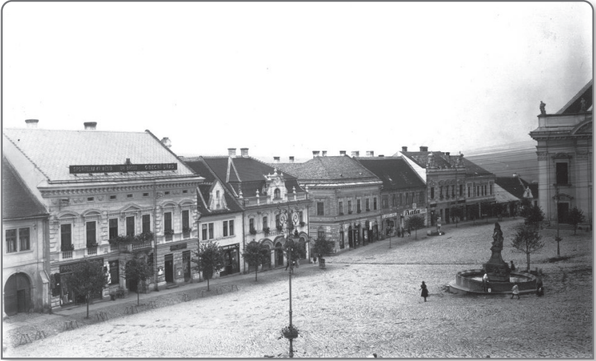
Uherský Brod 1926; Masarykovo náměstí.