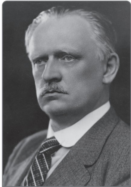
František Weyr.

Když se končil první semestr, toužil jsem navštěvovat Weyrův seminář. V poslední přednášce se odhodlávám a zastavuju Weyra. Stojí nade mnou na vysokém stupni posluchárny. „Prosím, pane profesore, budete mít příští semestr seminář z právní filozofie?“ vyřáším ze sebe celý uzardělý. Weyr mi z výšky položil ruku na rameno, zadívá se na mne, zálibně se zadívá, a když říkám, že bychom byli dva, odpovídá, že ano, že i pro dva bude pořádat seminář. „Víte, milý kolego, dva jsou někdy víc než dvacet,“