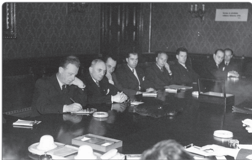
Na zasedání Bankovní rady Národní banky Československé 10. listopadu 1948 (zcela vlevo).

V roce 1941 se rozhodlo vedení Národní banky pro Čechy a Moravu přistoupit ve smyslu služebního řádu 39 ke zkouškám na vrchní kontrolory, jejichž úspěšné složení mělo zájemcům otevřít cestu k působení na vedoucích postech v ústavu. 40 Zkouška se konala před komisí 41 v ústní podobě,