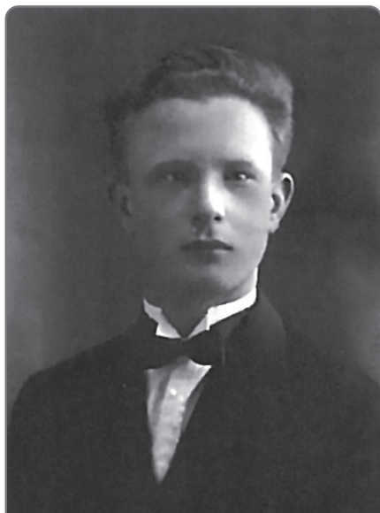
Maturitní foto.