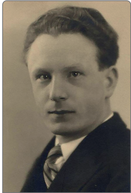
Po promoci 13. února 1932.