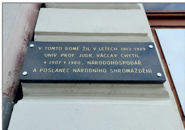
Pamětní deska ve Slavičíně.