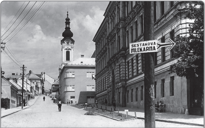
Uherský Brod; dnešní Komenského ulice s gymnáziem ve 30. letech minulého století.