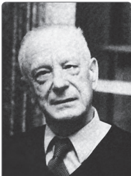
Po návratu z vězení (1958).