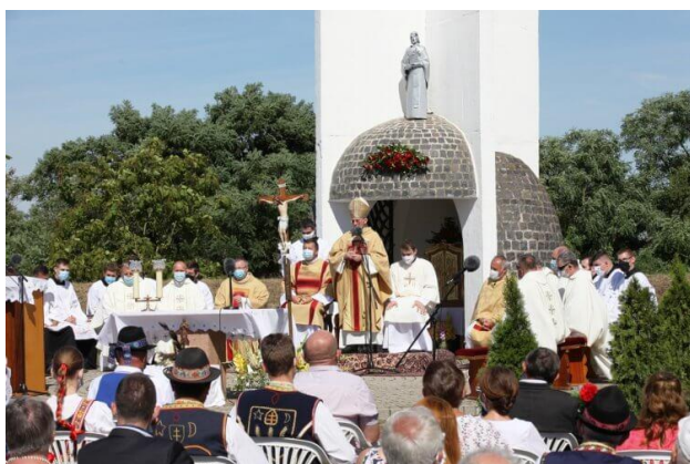
Zdroj: Lašut (2020)