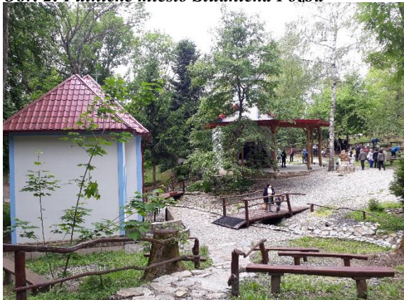
Obr. 2: Pútnické miesto Studnička Pozba