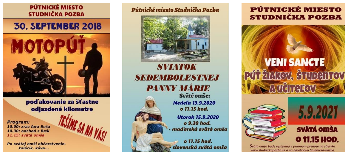
Obr. 3: Organizované púte na pútnickom mieste Studnička Pozba