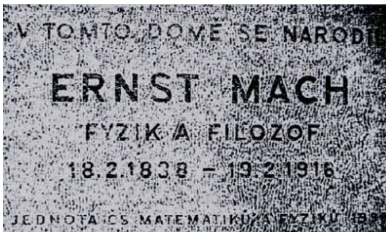
Obrázek 6: Machova pamětní deska „1988“.

pro veřejnost v Chrlicích v předvečer slavnostního odhalení desky vyslovil doc. Černohorský přání, „abychom mohli žít ve světě, ve kterém by se nikde na Zemi nemusely hledat pamětní desky těch, kdo se znalostí věci získanou sebeobětavým úsilím se zasloužili o to, aby lidské poznání proniklo hlouběji a aby lidé poznali lépe sami sebe“. S tímto posláním se do světa vydává i recenzovaná kniha. [...]"