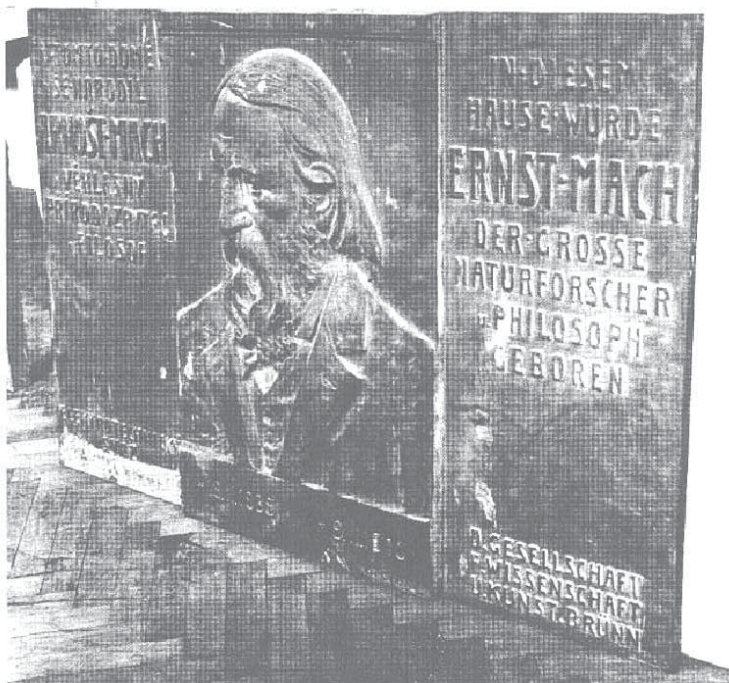
Obrázek 4: Machova pamětní deska „1938“ se zatřeným slovem „československý“. Fotografováno v srpnu nebo září 1943. Památkový ústav Brno. Archiv, inv. č. 17928.

V seznamu odevzdaných bronzových pomníků na Moravě [25] je Machova deska položkou číslo 1 a jsou u ní tyto údaje: 2