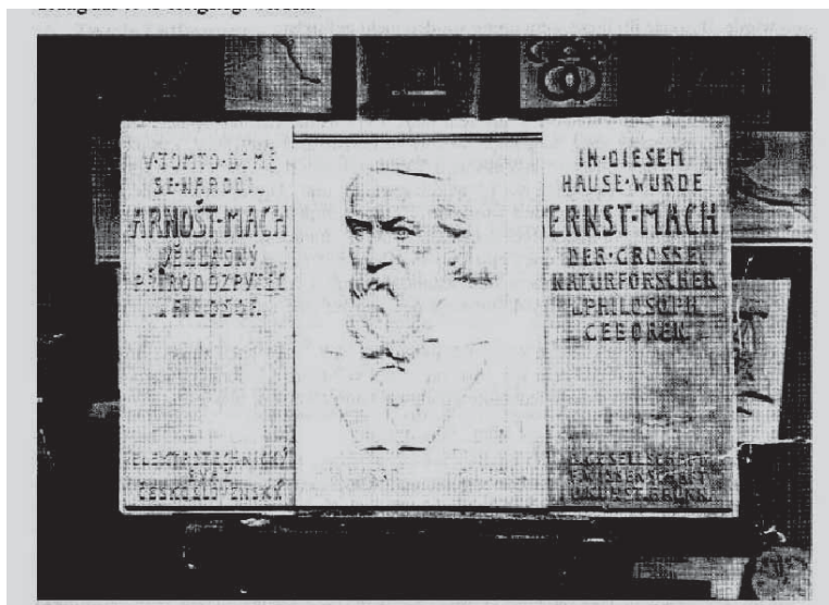
Obrázek 5: Korschannův sádrový model Machovy pamětní desky „1938“. Negativ E-5700/9110.

Jaký byl osud desky po jejím odvozu od Machova rodného domu v létě 1943, je tedy zatím neobjasněno. Jisté je, že deska sama válečnými událostmi nijak neutrpěla, jak dokazuje její poválečná reinstalace.