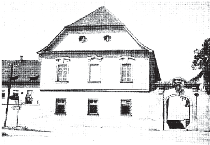
Obrázek 3: Machův rodný dům, srpen nebo září 1943, už bez pamětní desky „1938“. Památkový ústav Brno. Archiv, inv. č. 16949.

Ukázalo se, že válečný sběr kovů, organizovaný v brněnských městských institucích v roce 1943 [34], byl v oblasti památkové péče připravován už nejpozději na jaře 1942 [35, 37]. Pro záchranu Machovy desky mohlo být významné, že přednostou (Vorstand) Památkových úřadů v Praze a v Brně, jimž příslušela značná rozhodovací pravomoc, byl Prof. Kühn, který desku odhaloval [5, 10]. Do čela brněnského úřadu byl povolán již 29. 7. 1940 [36]. V seznamu bronzových pomníků na Moravě [38] posuzovaného v červenci 1942 je Machova pamětní deska uvedena řádkem „Nr. 47, Hierlitz bei Turas, Mach-Gedenktafel, 1938, Korschann, +“, přičemž symbol + značí, že desku lze sejmout (tj. že není zabudována napevno nesejmutelně (die Bemerkung + bedeutet, daß die Tafel abnehmbar ist). V dalším seznamu [39] je uvedena válečně opatrná formulace připouštějící výklad, že autor textu by si přál, aby deska byla zachráněna před obětováním na sběr kovu: